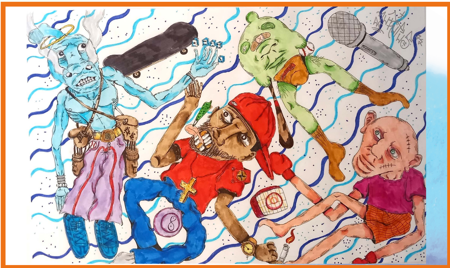
Examenkandidaat '22-'23: Kestin Smoorenburg "Speelvermaak"